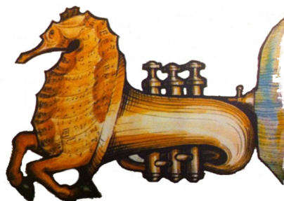
Dessin de Pierre Maguelon dit Petit Bobo

D'après une idée originale de Gilles Tcherniak